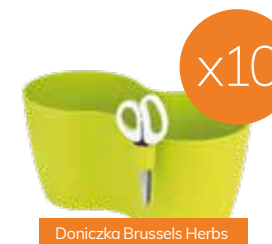
Doniczka Brussels Herbs