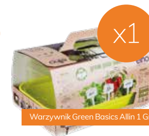
Warzywnik Green Basics Allin 1 Growkit